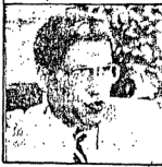
د. نعمان جمعة

طالب الدكتور نعمان جمعة نائب رئيس حزب الوند - بالإشراف الدوف على إنتخابات، مجلس الشعب لمنع التزوير . وأكد إعتراف الحزب خوض الإنتخابات في الدوائر التي لا يوجد بها مشاكل ونفى ان يكون حزب الوند بوابة لدخول المطرودين من الحزب الوطني لترشيحهم في الإنتخابات القادمة وأكد التزام الحزب برشيع الوفديين فقط . وأشار إلى انه سيتم الإعلان رسميا عن أسماء المرشحين ، عقب إنتهاء المشاكل الخاصة باعداد قائمة المرشحين في لجنة القاهرة . التي اعدت قائمة بأسماء مرشحيها وأرسلتها إلى فؤاد سراج الدين رئيس الحزب . ويتم مراجعتها حاليا من خلال لجنة تم تشكيلها لحسم بعض المشاكل الخاصة بعدد من المرشحين في بعض الدوائر وأعلن جمعة إعتراف رئيس الحزب حل الخلافات في ترشيحات لجنة القاهرة في حالة فشل اللجنة في التوصل إلى حل بشأنها جاء ذلك في الندوة الأسبوعية التي عقدها الدكتور نعمان في مقر الحزب بالدفى الأسبوع الماضي .